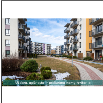
Uždara, apšviesta ir prižiūrima namų teritorija