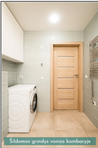
Šildomos grindys vonios kambaryje