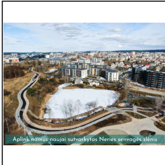
Aplink namus naujai sutvarkytas Neris senvagės slėnis