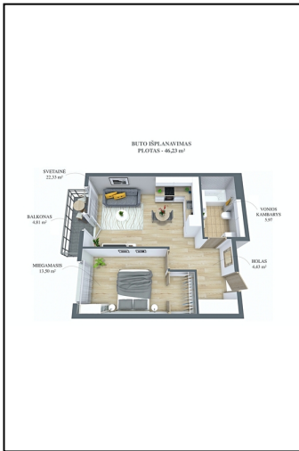
BUTO IŠPLANAVIMAS PLOTIS - 66,27 m 2 SVEITINĖ 22,07 m 2 BALKONAS 4,89 m 2 MIEGAMASIS 13,94 m 2 VONIOS KAMBARYS 5,87 m 2 KUCIJA 4,02 m 2