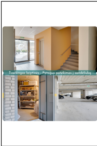
Tvarkingos laiptinės - Patogus patekimas į sandėliuką