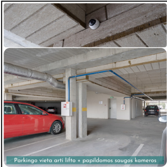
Parkingo vieta arti lifto + papildomos saugos kameros