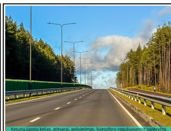
Keturių juostų kelias, atbairai, apšvietimas, šviesoforo reguliacijos galimybioms